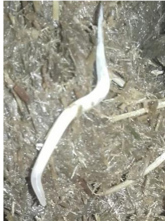
Oxyuris equi in seiner vollen Länge

Dieser weitgehend ungefährliche, aber sehr lästige Endoparasit ist dafür verantwortlich, dass Schweifscheuern beim Pferd lange Jahre mit Wurmbefall gleichgesetzt wurde.