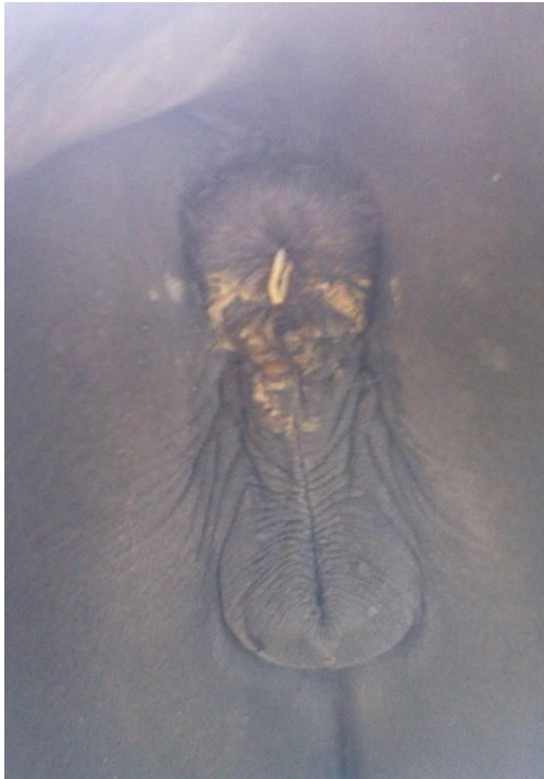
Pfriemenschwanz, der zur Eiablage in Erscheinung tritt